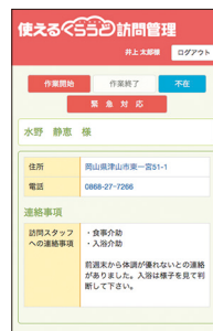
● サービス開始・終了報告もタッチするだけ!