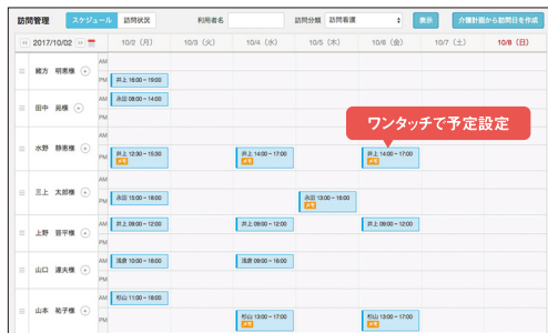
● 訪問スケジュール作成画面