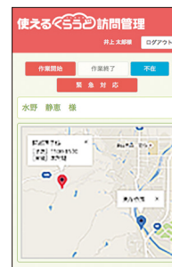
● 訪問先情報 & 現在位置を地図上で確認OK!