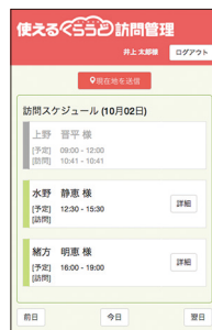
● 訪問先からの到着報告は画面タッチで完了!

また出先で当日の予定や訪問先情報をスマートフォンやタブレットPCで確認していただけます。現在地と目的地のマップ表示も可能で、訪問先までのルートチェックも簡単に行えます。